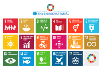
Figur 3 FNs Bærekraftsmål

Mange av kommunen sine oppgaver er styrt av nasjonale lover og forskrifter. Plan- og bygningsloven og kommuneloven krever at kommunene skal bidra til bærekraftig utvikling, gjennom samordna og helhetlig planlegging. FN's menneskerettigheter og bærekraftsmål skal ligge til grunn i planarbeidet. En bærekraftig samfunnsutvikling er en utvikling som imøtekommer dagens behov uten å ødelegge mulighetene for at kommende generasjoner skal få dekket sine behov. For å ivareta en bærekraftig utvikling må det i planarbeidet tas hensyn til alle tre bærekraftsområdene; klima og miljø, økonomi og sosiale forhold.